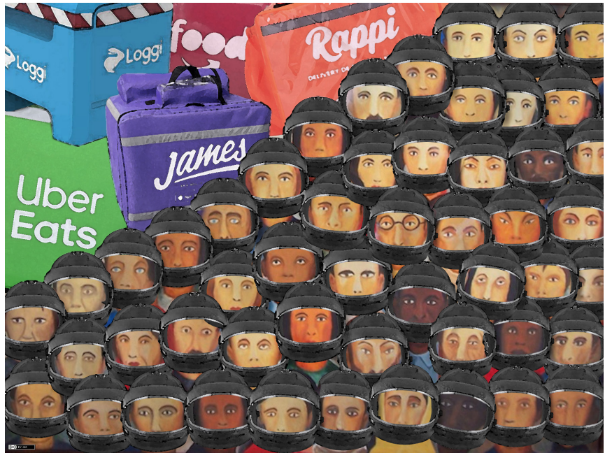
Operários do novo normal - Denis Gonsales

A estas alturas, la pirámide de riqueza ya se hizo mucho más pronunciada y modificó su perfil a favor de las actividades de alta tecnología y comunicación (las famosas GAFAM 1 ), y también de las extractivas que les dan soporte a ellas (litio, coltán) y al proceso de reproducción material en su conjunto (minerías, energéticas). Jeff Bezos, el hombre más adinerado de Estados Unidos, ganó 149,319 dólares por minuto durante 2019, es decir, 8 millones 959,140 dólares la hora, mientras que un trabajador con salario mínimo gana 7,25 dólares la hora en el mismo país (en el Sur